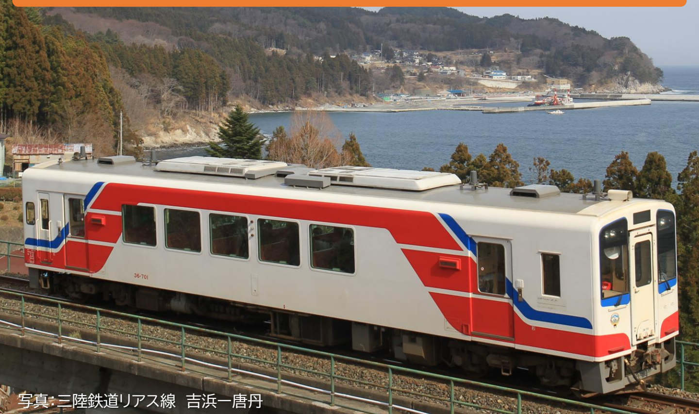
写真:三陸鉄道リアス線 吉浜一唐丹

2024/4/1→2025/3/30ご出発分まで ※ご出発の7営業日前までにお申込ください